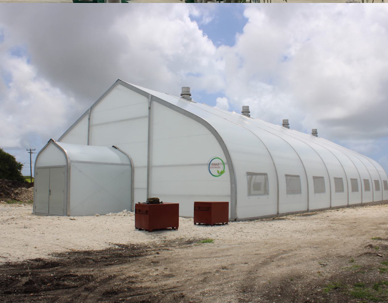
Flyer Gewächshäuser V1.2

Die Evolution... Sprung Membranen Gewächshäuser